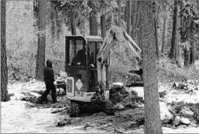
Der kleine Bagger war da und hat den Platz von Humus befreit und die störenden Wurzeln entfernt.