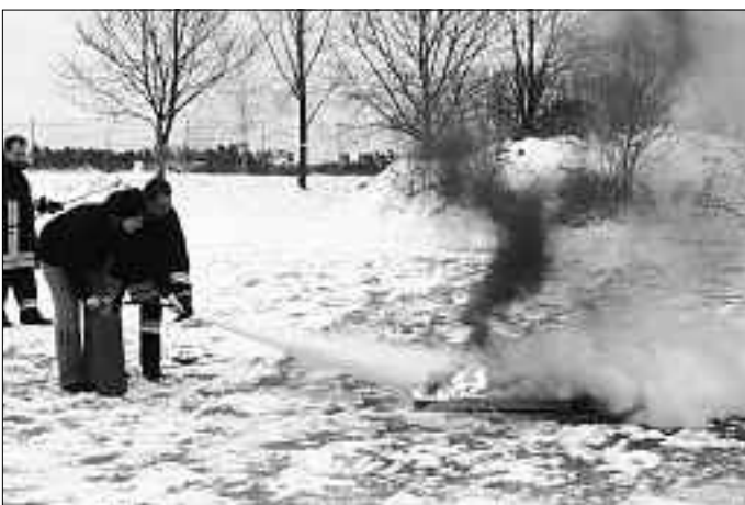
Das Naturkindergarten-Team wurde von der örtlichen Feuerwehr geschult, wie man Feuerlöscher bedient.